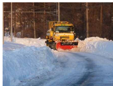
平成26年2月豪雪時 長野県軽井沢地先の国道18号