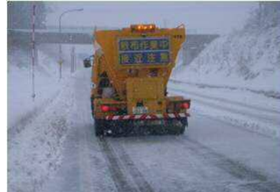
凍結防止剤散布車