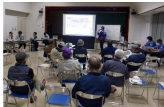
▲ 上大賀地区久慈岡区 (常陸大宮市)

○設計内容の説明の実施・・・常陸大宮市上大賀地区久慈岡区、常陸太田市堅磐町地区では、地域の皆様から説明会開催のご要望がございましたので、新型コロナウイルス感染拡大防止対策に配慮しながら、地元説明会を開催し設計内容や用地測量等に関する説明を行いました。