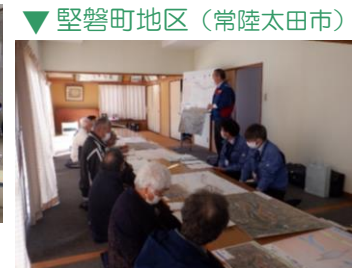
▼ 堅磐町地区 (常陸太田市)