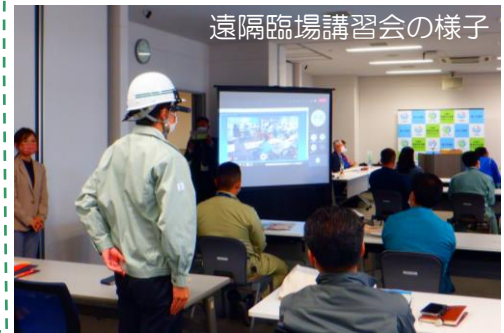
遠隔臨場講習会の様子