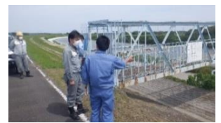
樋管の点検の様子

5月25日と26日の2日間、常陸河川国道事務所では、自治体など共同で自治体などが占有・管理している施設（樋管、橋梁等）の確認・点検を行いました。台風や大雨が多くなる6月～10月の出水期を迎えるにあたり、適切な管理がなされているか、施設に不具合がないかなどを双方で点検しています。