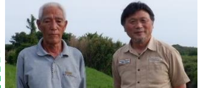
常陸太田市堅磐地区