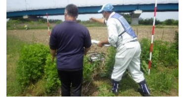
額田地区での土地境界立会の様子

常陸大宮市の家和楽地区ストックヤードでは、川の中を掘削した土砂と、常陸大宮市や大子町の工事で発生した土砂を混合して、堤防に適した土を造るための土質改良の準備を進めています。