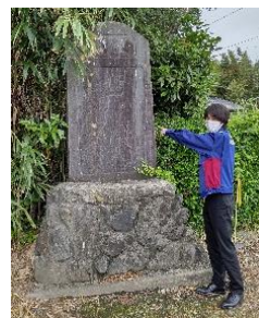
5月14日に新たに登録・公開されました