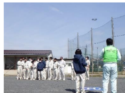
ドローン 操作体験

参加した生徒から、「河川の氾濫場所を分担し夜間にも復旧作業を行い、私たちは沢山の人手と苦勞で守られていることが分かった。」といった感想が寄せられました。