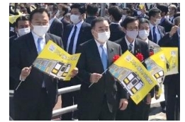
知事らによる歓迎