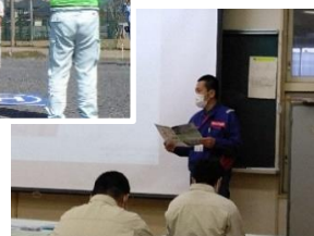
プロジェクトの進捗状況説明