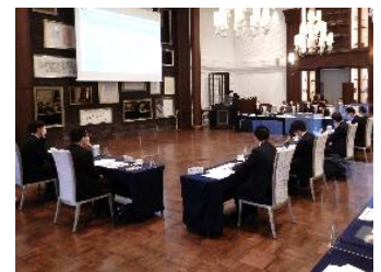
大子まちなかビジョン推進協議会

大子町では、令和元年東日本台風での甚大な被害を受け、昨年10月から、庁舎移転に伴う防災力の強化や、交流人口の増加によるにぎわいづくり等を盛り込んだ、大子まちなかビジョンの検討を開始し、3月31日に策定、公表されました。ビジョンには、現在の役場庁舎跡地の利活用や「道の駅 奥久慈だいていご」の防災・交流機能強化を中心とした今後の大子町の取り組みや、久慈川緊急治水対策プロジェクトが盛り込まれています。