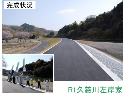
完成状況 フレフレ水郡線(R3.3.27)

令和2年度は、既存堤防の嵩上げ、河道の掘削といった用地取得を必要としない地区において、3工事を発注し、3月末までに無事故・無災害で工事を終えることができました。いずれも地域の守り手である地元建設会社が施工を担当し、丁寧かつ迅速に工事を仕上げてくださいました。各工事の完成状況と担当者をご紹介します。