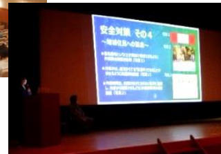
受注者による発表状況