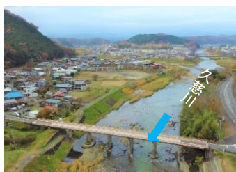
ドローンによる調査 (大子町)

ドローンによる調査や現地調査による立ち入り等について、引き続き地域のみな様のご協力をお願いします。