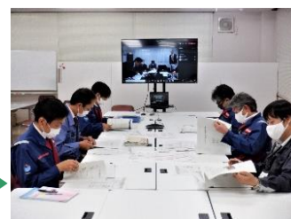
築堤詳細設計の打合せ (WEB)