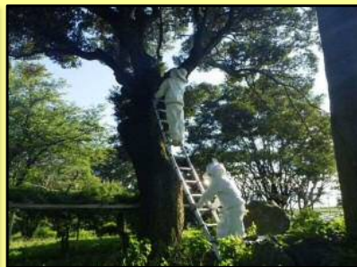
スズメバチの巣撤去 (中之島公園内)

河川を安全に利用いただくため、特にゴールデンウィークや夏休み期間中は利用者の増加が見込まれることから、重点的に河川管理施設の点検を行い、危険箇所の改善を行って