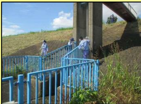
安全利用点検の様子