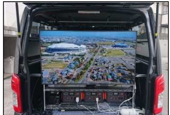
【実際の車載モニター映像】