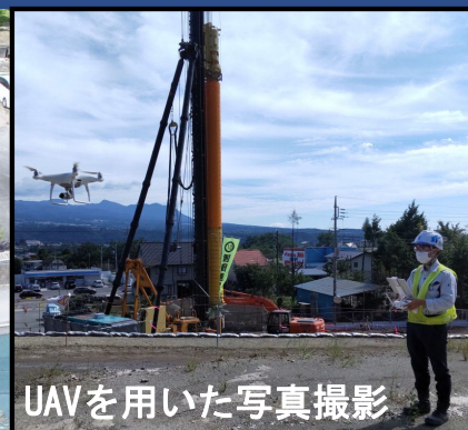
UAVを用いた写真撮影