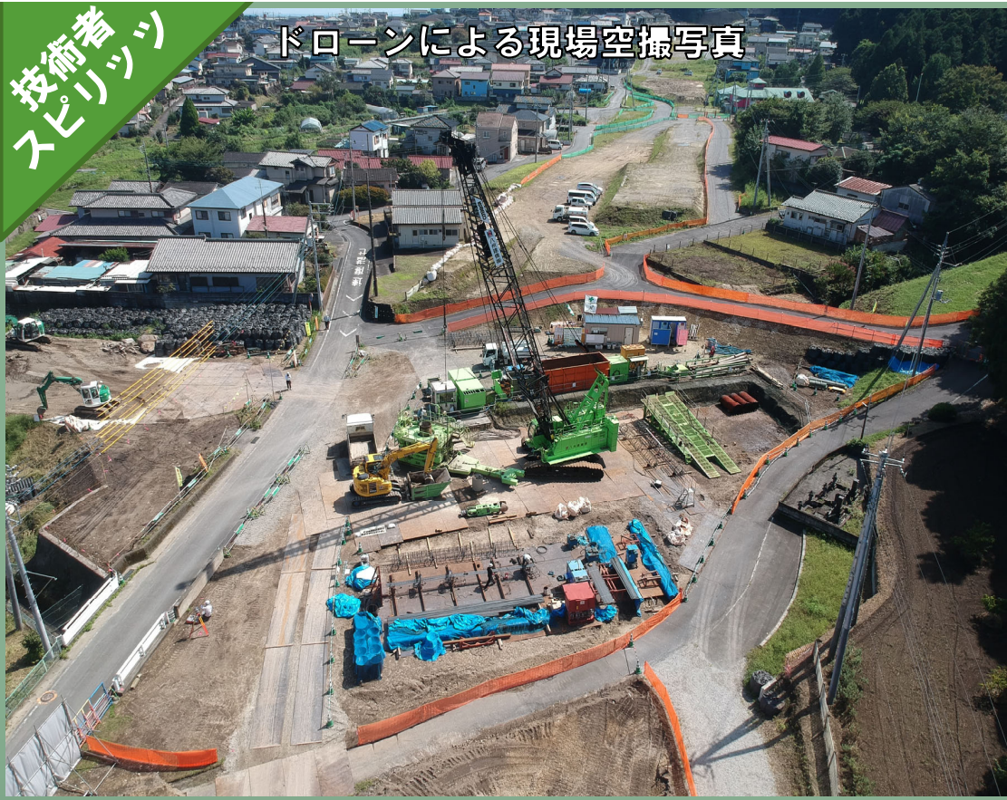
ドローンによる現場空撮写真