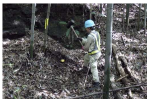
下境地区幅杭設置