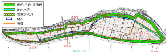
大場遊水地説明会