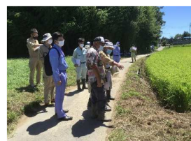
吉沼地区境界立会