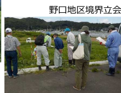
野口地区境界立会