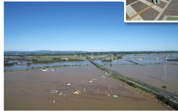
水戸北スマートインターチェンジ周辺