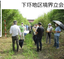
下坏地区境界立会