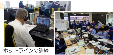
ホットラインの訓練

○様々な洪水が発生したことを想定して、久慈川・那珂川の両河川での決壊や同時多発的な氾濫などを設定し、その対応として、緊急復旧工法の検討や氾濫情報や水防警報の発出を行うとともに、常陸大宮市とホットラインによる情報のやりとりや気象庁との連絡体制の確認など、実践的な演習を行っています。