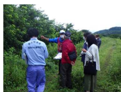
下伊勢畑地区境界立会