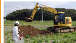
勝田地区埋蔵文化財調査