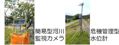
簡易型河川監視カメラ

○適切な避難判断ができるよう、危機管理型水位計と簡易型河川監視カメラを増設しました。