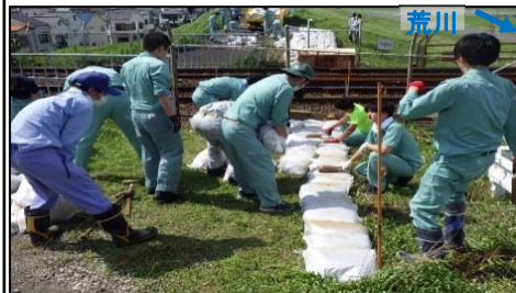
土のう設置作業【荒川右岸(足立区)】