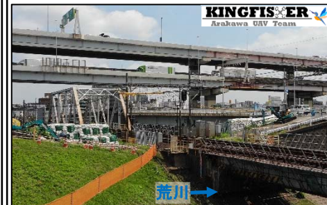
葛飾区側のパラペット(施工中)