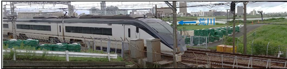
土のうの設置が完了した堤防の切り欠き部【荒川左岸(葛飾区)】

・令和元年東日本台風を踏まえ令和2年度に足立区と葛飾区は荒川橋梁周辺部の堤防の切り欠き部に暫定的な取り組みとして土のうを設置