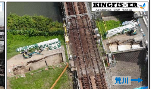
葛飾区側のパラペット(施工中)