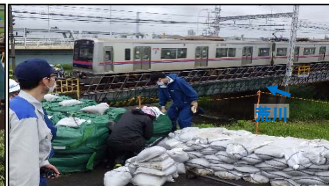
土のう設置作業【荒川左岸(葛飾区)】