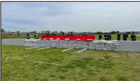
足立区の水防訓練(令和3年5月28日)