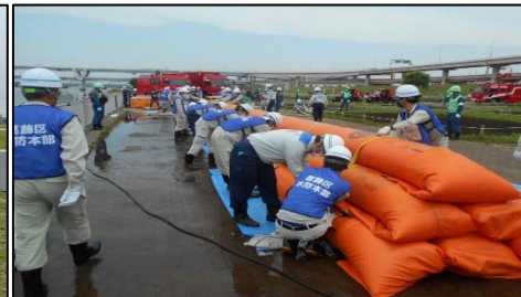
葛飾区の水防訓練(令和3年5月29日)