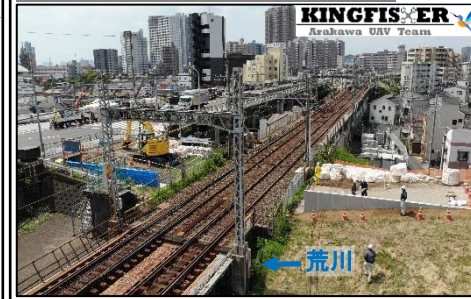
足立区側のパラペット(上流と下流)