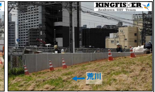
足立区側のパラペット(上流)