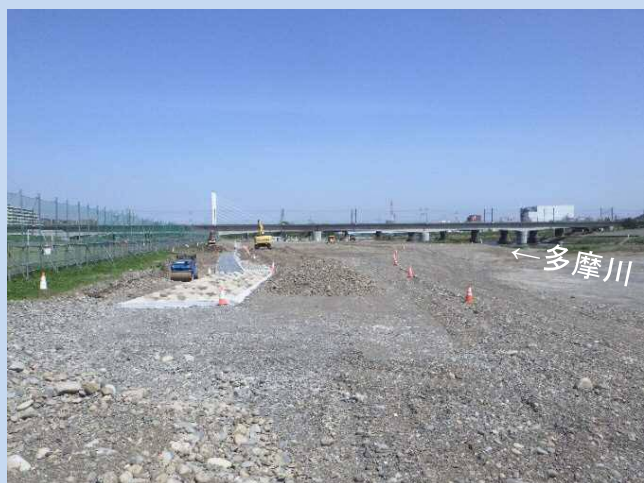
最後の仕上げをしています。 (令和4年4月)