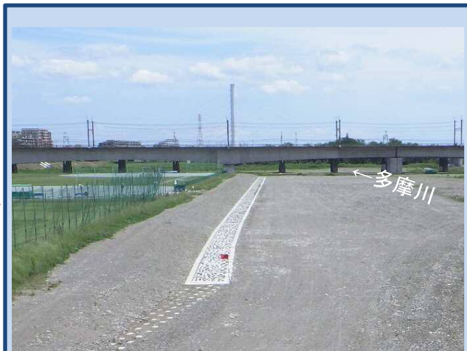
完成しました。 (令和4年5月)