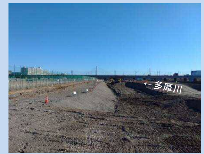
護岸を施工するための 準備をしています(令和4年1月)