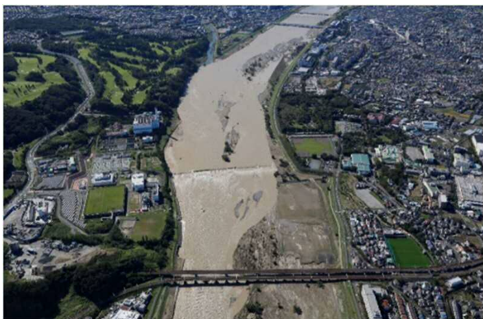
工事箇所付近における 令和元年東日本台風通過後の状況