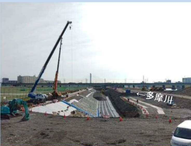
護岸を施工しています(令和4年3月)