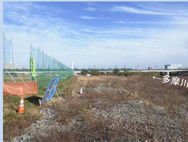
仮囲いや防球ネットを設置しました。 (令和3年11月)