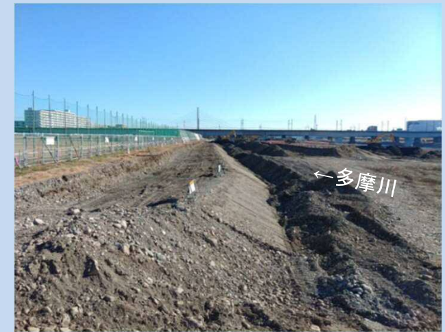
護岸を施工するための 準備をしています(令和3年12月)