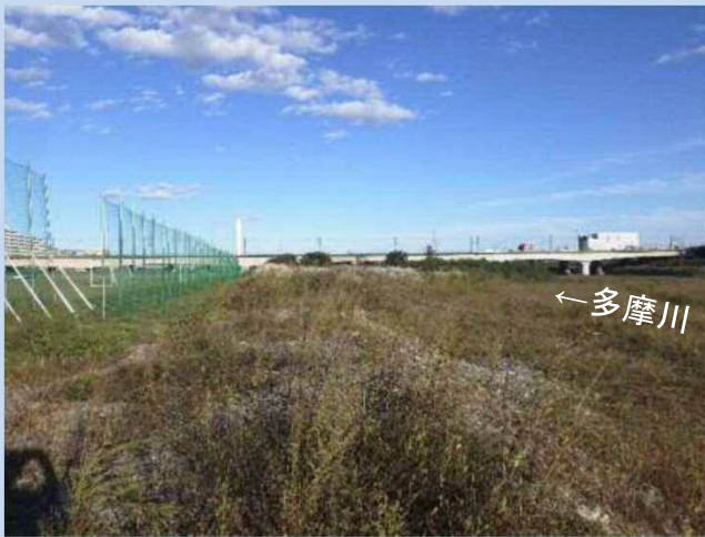
工事着手前(令和3年4月)