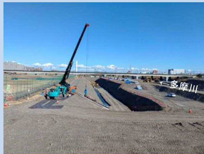
護岸を施工しています(令和4年2月)