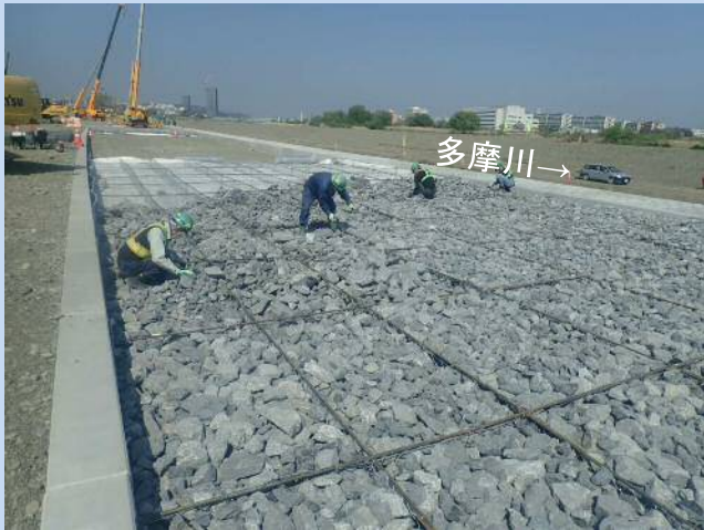
護岸平場にかごマットを敷設しています。(令和4年4月)