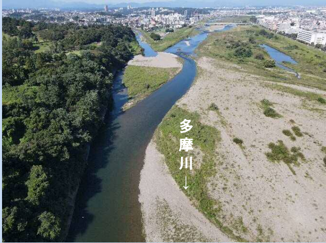
工事着手前(令和3年9月)