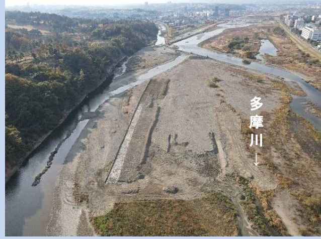
施工箇所に水が入らないように川の 流れを変えています(令和3年11月)