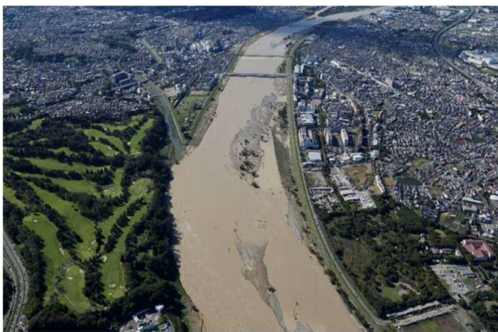
工事箇所付近における 令和元年東日本台風通過後の状況