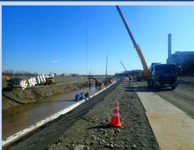
護岸を施工しています。 (令和4年2月)