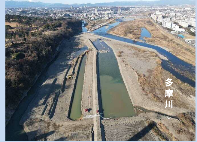
護岸を施工するための 準備をしています(令和3年12月)