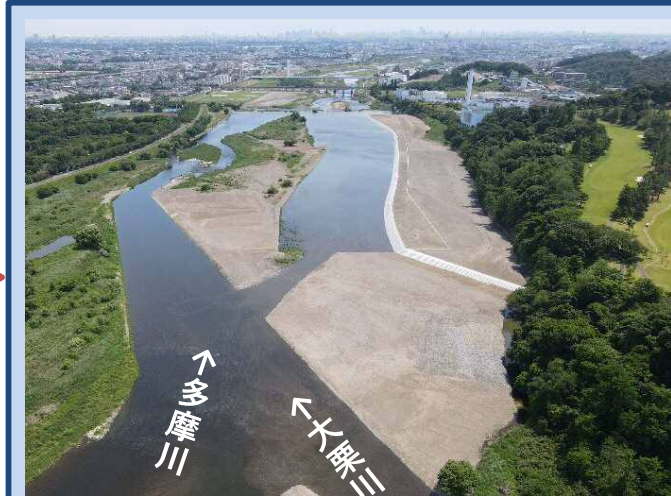
完成了ました。 (令和4年5月)