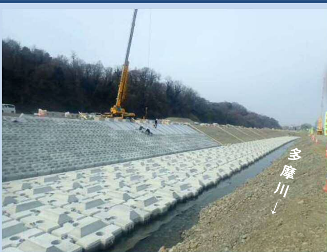
護岸を施工しています。 (令和4年3月)