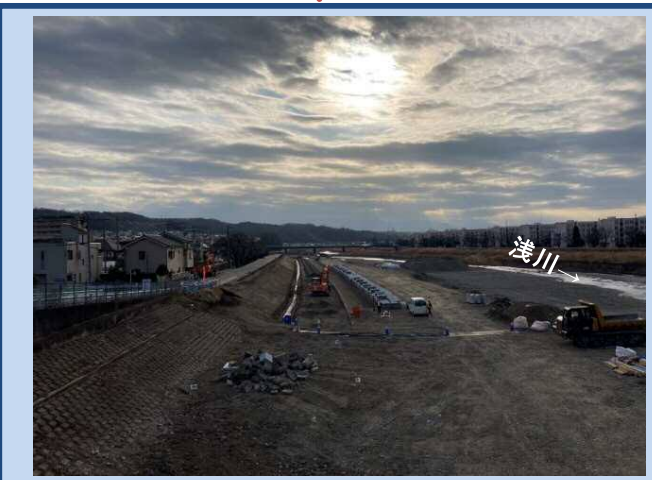
護岸を施工しています。 (令和4年1月)