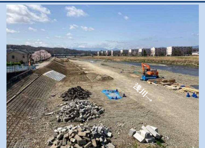
護岸を施工しています。 (令和4年3月)