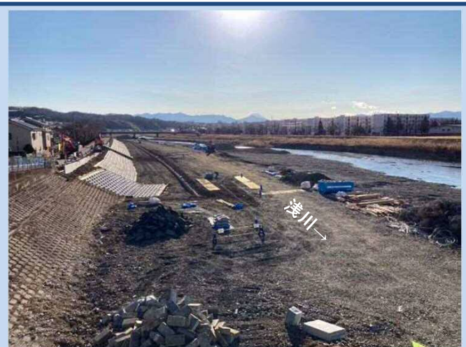
護岸を施工しています。 (令和4年2月)