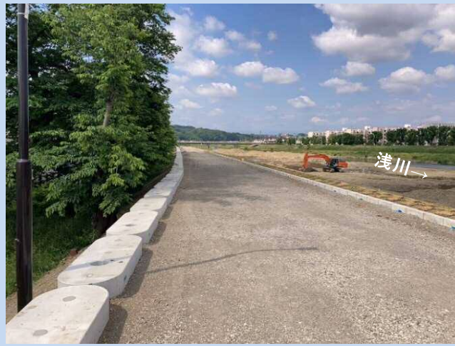
堤防天端を整備しました。 (令和4年5月)