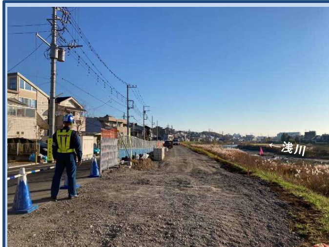
盛土が完了しました。今後は舗装を進めます。(令和3年11月)