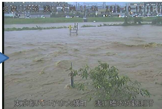
工事箇所付近における 令和元年東日本台風の状況