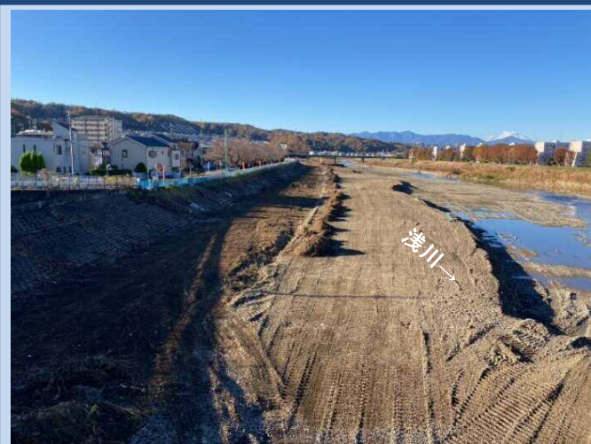
工事用道路を設置しています (令和3年11月)