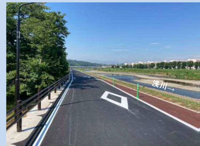
完成了しました。 (令和4年6月)