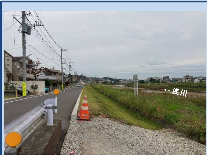
工事着手前(令和3年10月)