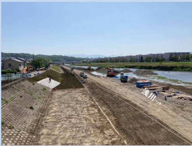
法面に芝を張っています。 (令和4年4月)