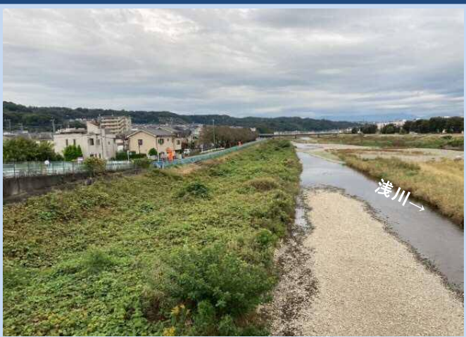
工事着手前(令和3年10月)