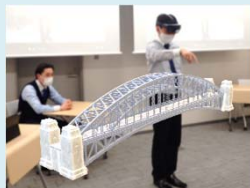
VR・AR・MRを活用した 施工体験等