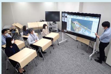
セミナーや研修等の開催、遠隔参加