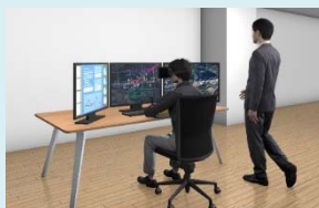
無人化施工実習 (イメージ)