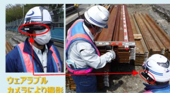
ウェアラブル カメラにより撮影