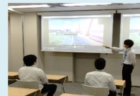
BIM/CIM、データ/デジタル 技術に関する研修