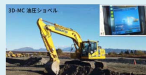
3D-MC 油圧ショベル 施工(ICT施工)