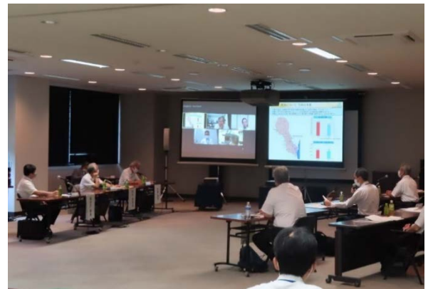
第7回那珂樋管設置魚類迷入（吸い込み）防止対策効果試験検討委員会の様子

今回の委員会では、これまでの魚類迷入試験結果、及び次回試験計画について、有識者の皆様から意見を伺いました。より良い施設が出来るよう関係者の皆様から意見を伺い事業を進めて参ります。