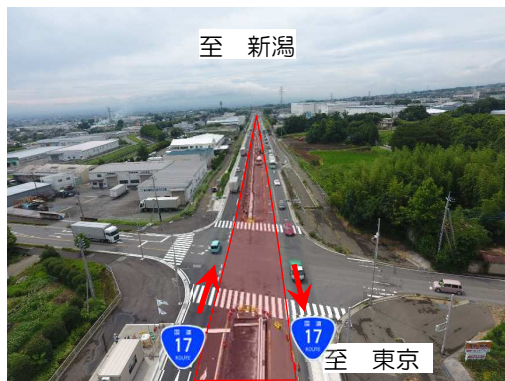
五代工業団地付近・施工状況（R3.7末） ※外側2車線通行、中央分離帯施工中（薄赤範囲）