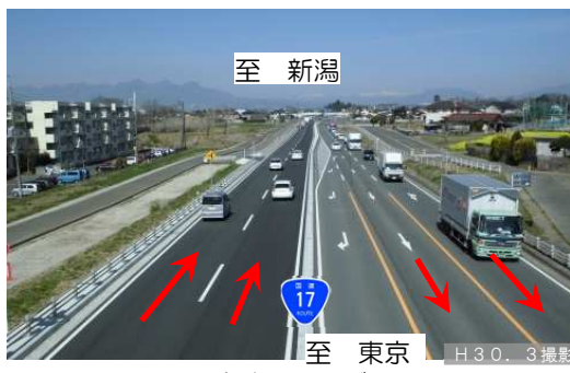
—完成イメージ— （上武江木交差点付近の状況）