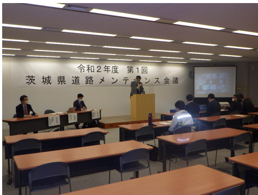
【令和2年度第1回会議の開催状況(R2.12.22 Web開催)】