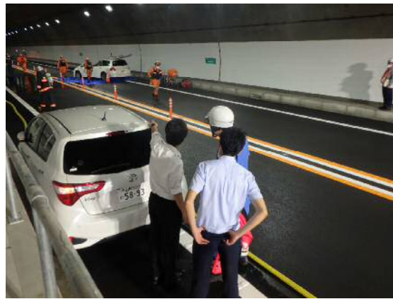
事故検分訓練状況