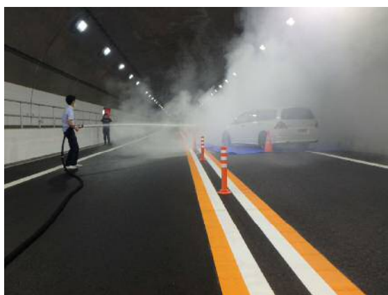
初期消火訓練状況