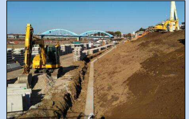
護岸を施工しています。 (令和3年12月)