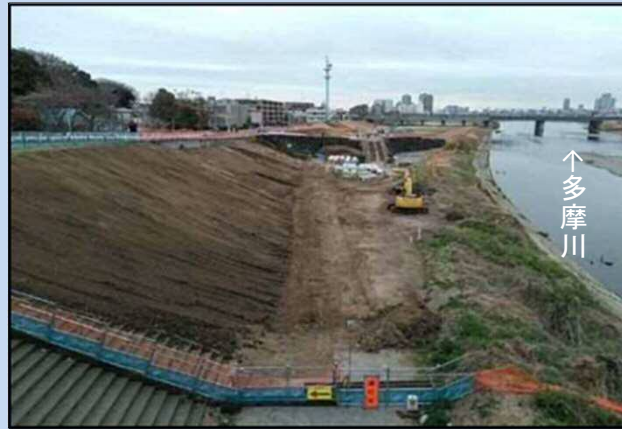
護岸を施工しています。 (令和4年3月)