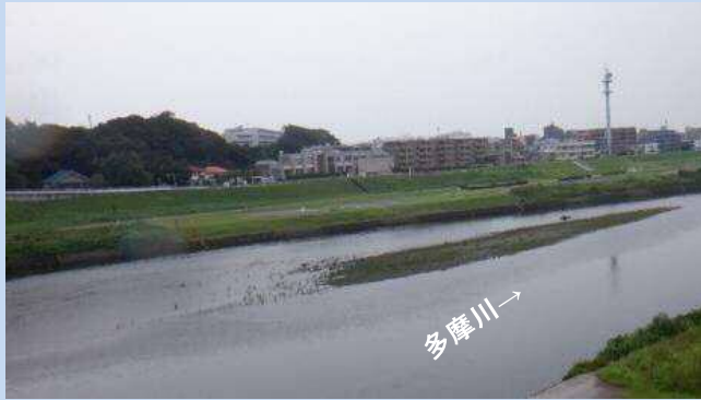
工事着手前(令和3年7月)