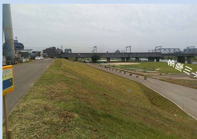
完成了しました。 (令和4年6月)