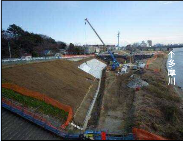
護岸を施工しています。 (令和4年2月)