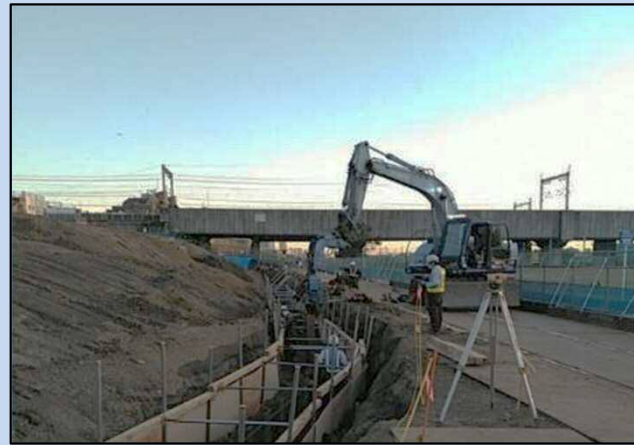
護岸を施工しています。 (令和3年11月)