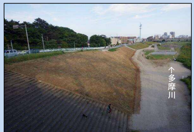
築堤が完成了しました。 (令和4年5月)