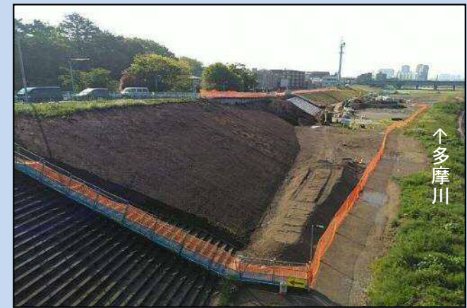
護岸を施工しています。 (令和4年4月)