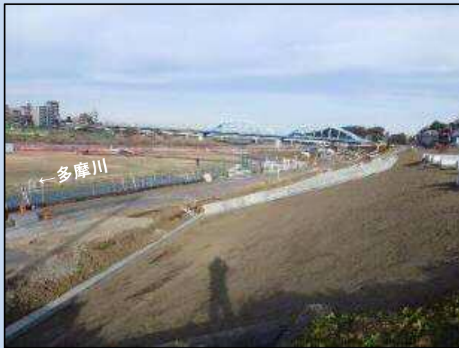
護岸を施工しています。(令和4年1月)