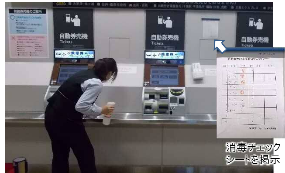
自動発券機の消毒