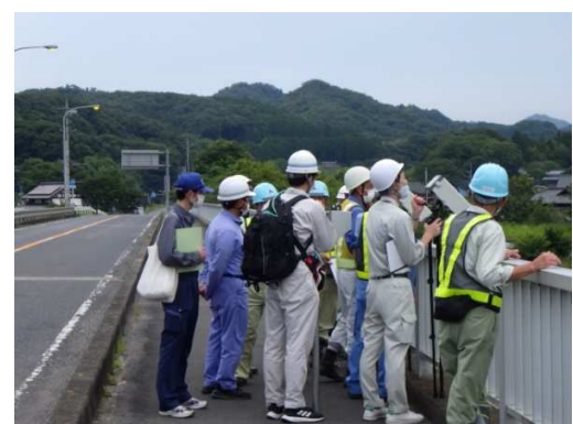
観測の体験の様子