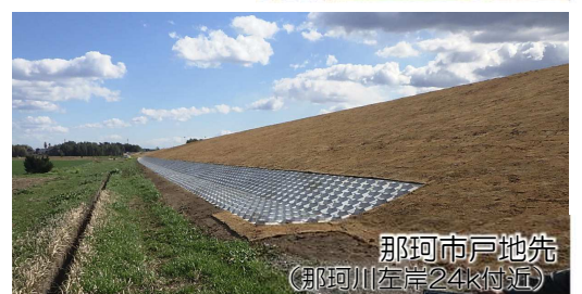
那珂市戸地先 (那珂川左岸24㍓付近)