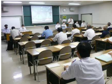
移転対象者へ説明 (大場遊水地説明会)