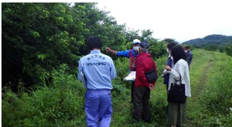
下伊勢畑地区 立会状況