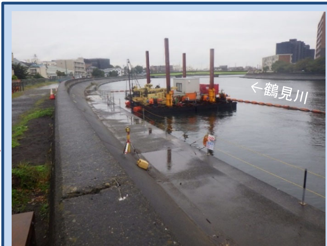
河川内の地盤改良をしています (令和3年10月)