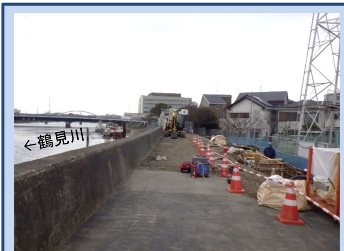
片付け等をしています (令和4年1月)