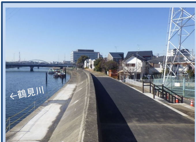
完成了しました (令和4年2月)