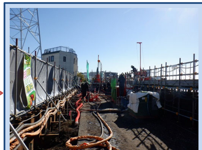
堤防の地盤改良をしています (令和3年11月)