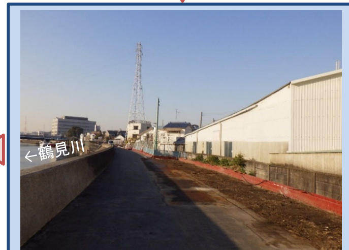
堤防の地盤改良が完了しました (令和3年12月)