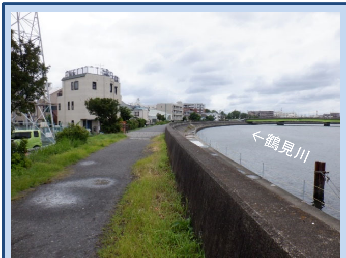
工事着手前 (令和3年7月)