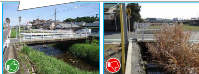
講習で用いた資料の一例