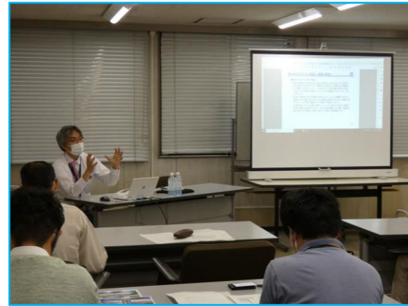
橋梁の箇所ごとの点検ポイントを解説

溝橋等の直営点検を行うにあたって、橋梁の種類別の点検ポイントをはじめ、診断の着目点、現地状況の記録を行う際の留意点等について、座学による説明を行いました。