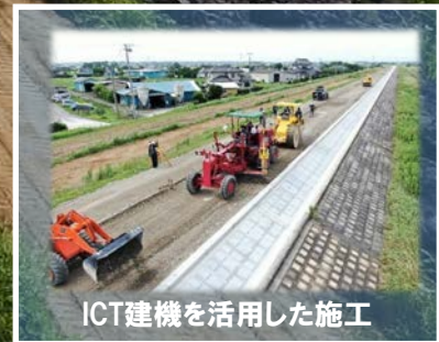
ICT建機を活用した施工