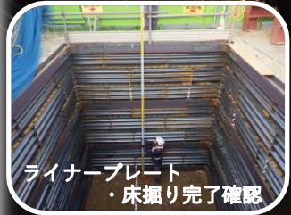
ライナープレート ・床掘り完了確認