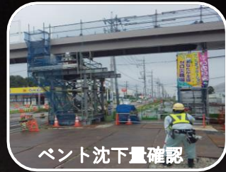
ベント沈下量確認