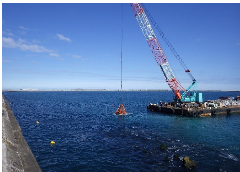
基礎捨石投入状況