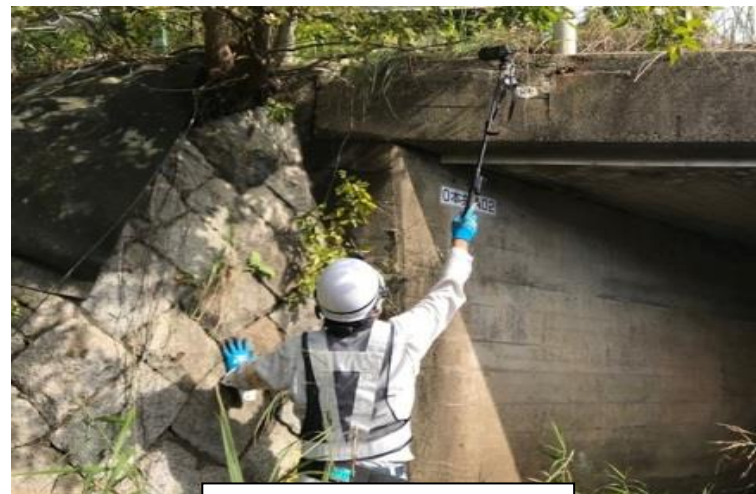
近接目視の代用（自撮り棒）