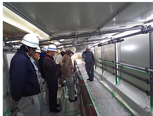
(橋梁修繕工事現場見学会の実施状況)