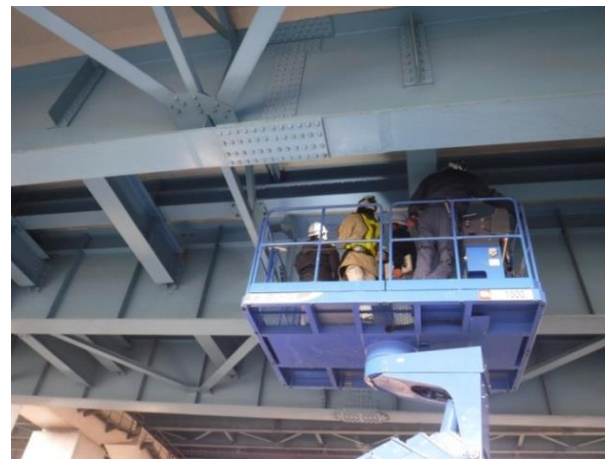
(橋梁点検実務講習会の実施状況)

対象：自治体職員 予定人数：20名程度 時期：冬頃＜半日間＞ 場所：千葉県内の国管理の橋梁 目的：橋梁補修に関する基礎知識を習得するため