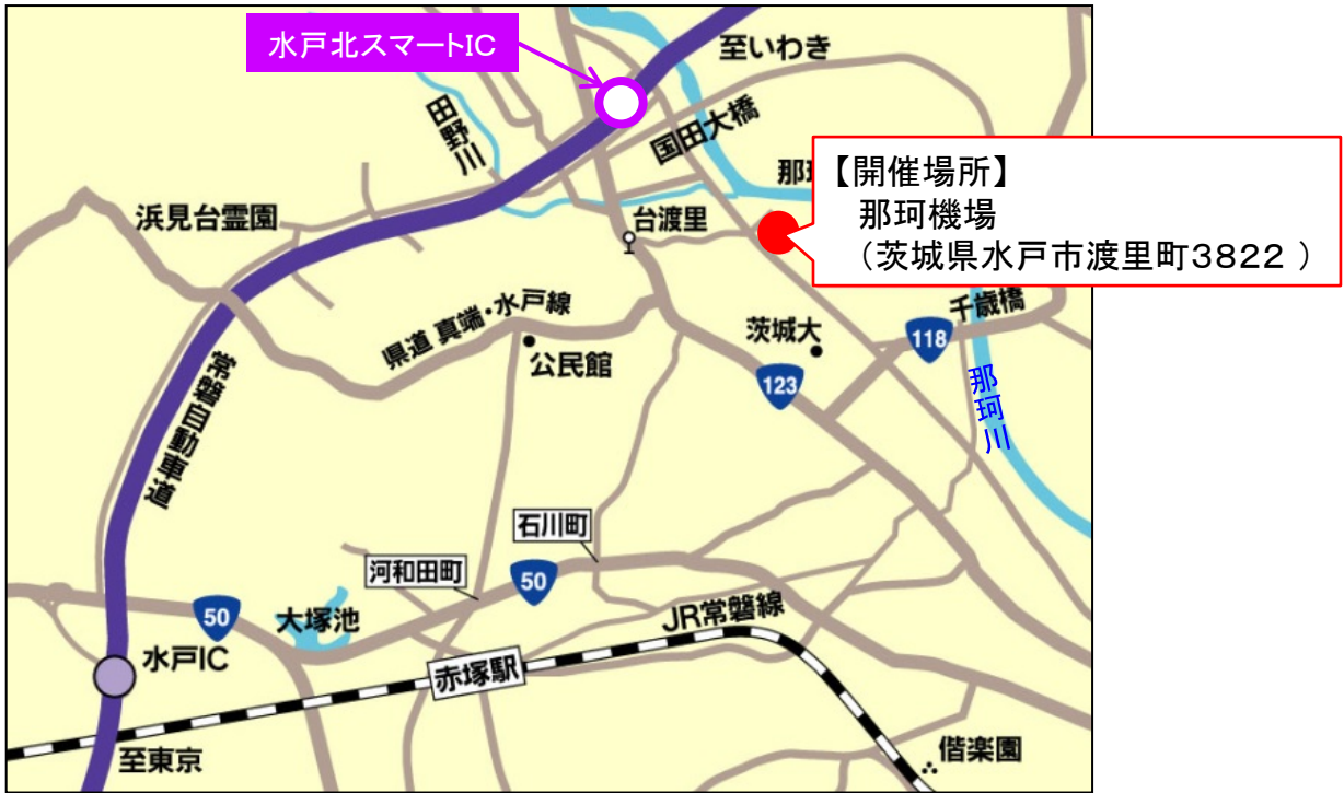
開催場所の詳細図