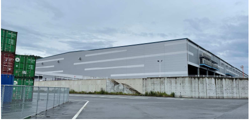
⑧国際物流センター（令和2年開設）R3.6.19撮影