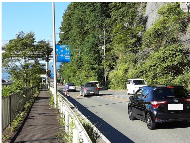
交通開放後(東京側から御殿場方面を望む)