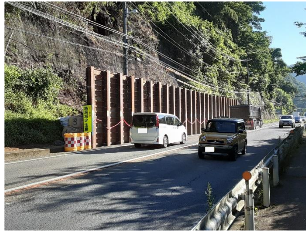
交通開放後(御殿場側から東京方面を望む)