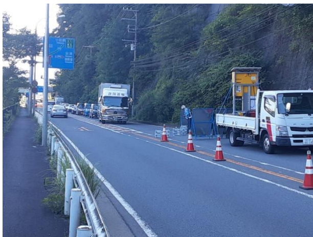
交通開放前(東京側から御殿場方面を望む)

今後も現地条件により安全確保のため、通行止めとなる場合があります。詳細は横浜国道事務所HPをご覧ください。