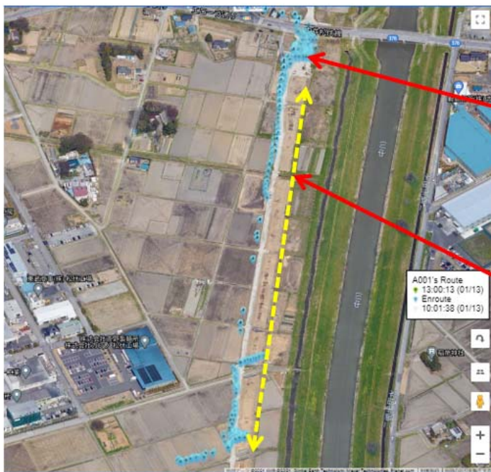
準天頂衛星情報使用のGPS-LoRaセンサの位置表示