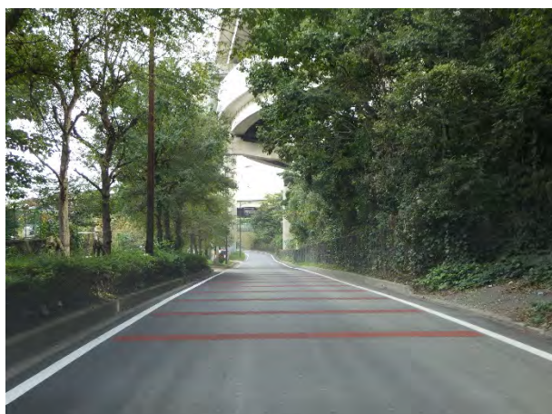
【国道298号側道部の舗装修繕後】