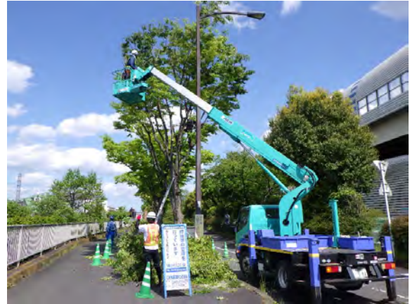
【高所での剪定作業】