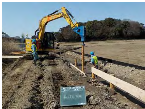
【木柵水路施工状況】

また、地元調整等においては、地権者・耕作者及び関係機関との調整を綿密且つ丁寧に行ったことにより、厳しい工程条件の中、適切な品質を確保し、無事故で工事を完成させた。