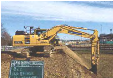
【ICT重機を最大限活用】