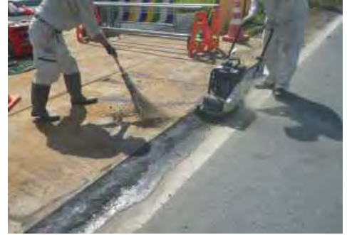
【橋梁下部工のコンクリート打設に関する新技術活用】