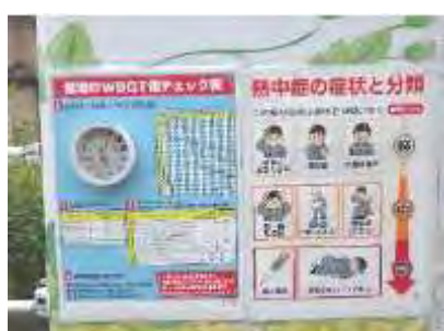
【熱中症対策の実施（WBGT値を活用した体調管理）】