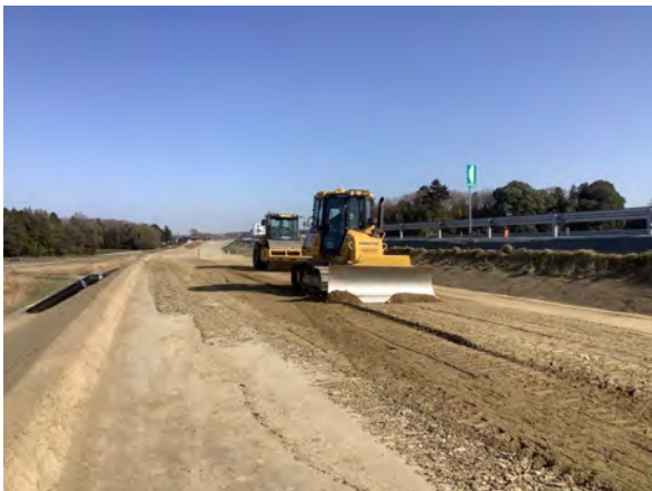
【路体盛土施工状況】

また、既供用の本線に対する影響把握のため、40mピッチの測点による動態観測を日々実施し、周辺地域に影響を及ぼすことなく工事を完成させた。