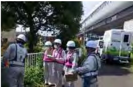
【なでしこパトロール隊の活躍】