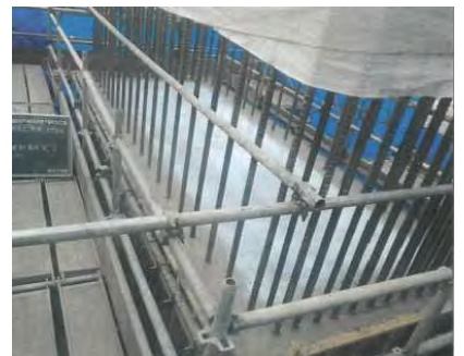
【構造物の機能性維持のため新技術を活用】