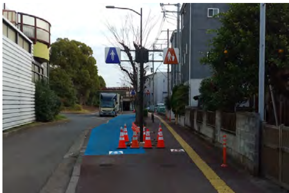
【自転車・歩行者区分看板設置】