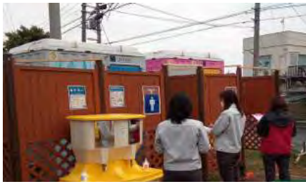
【女性パトロール隊結成】