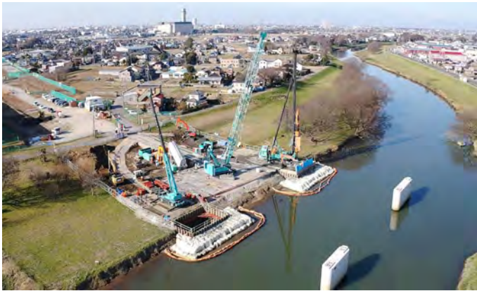
【橋梁下部工施工中】