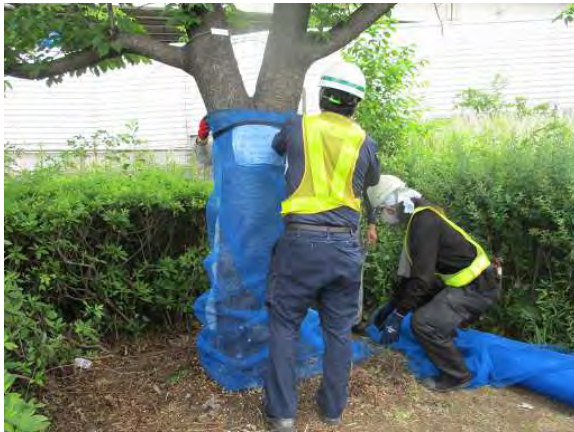
【樹木保護シートの設置】