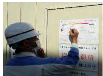
【インターンシップ開催で将来の担い手確保に取り組む】 【検温チェックシート記入】