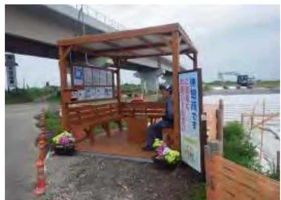
【現場見学スペースの設置】