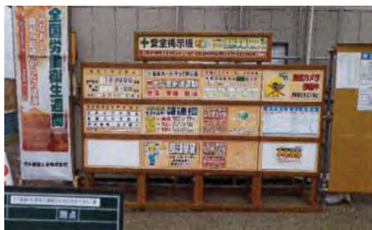
【環境へ配慮した新技術の看板】