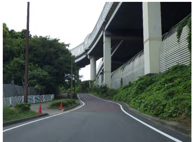
【側道湾曲部の舗装修繕後】