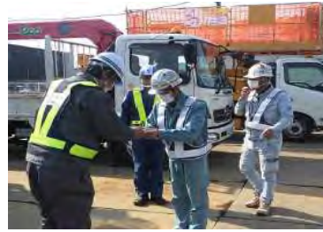
【毎月の安全賞授与式】