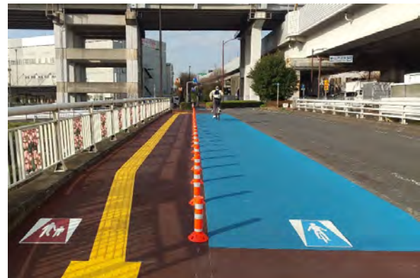
【舗装の色分けで明示】