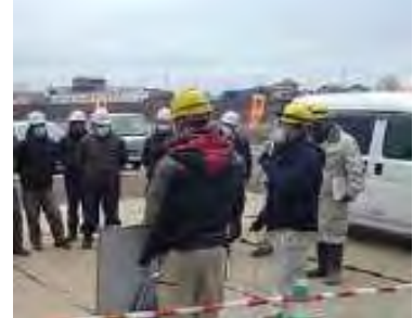
【インターンシップ開催で建設業の魅力発信に取り組む】