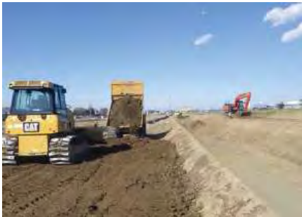
【ICT技術で作業効率を図る】