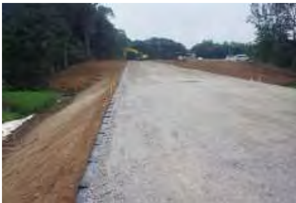
【工事用道路設置状況】

また、安全管理について接触事故防止などの工夫を行ったり、地域住民とのコミュニケーションを図るため、独自の現場見学スペースを設置し、建設現場の情報を共有することで、地域理解を得て、遅延無く、円滑に工事を完成させた。