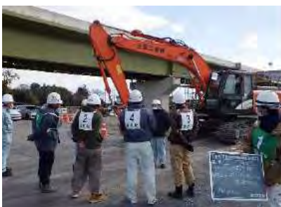
【安全衛生教育の実施状況】