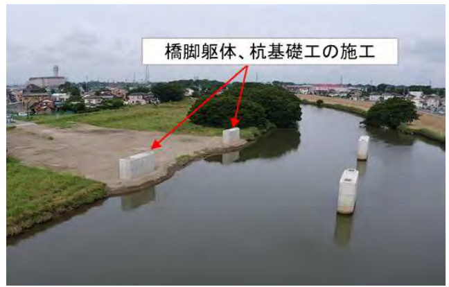
【橋脚躯体・杭基礎工完成】