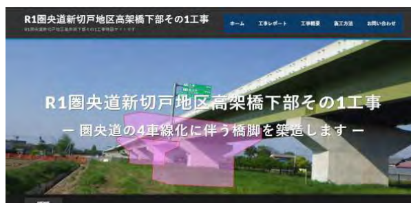
【現場ホームページの開設】