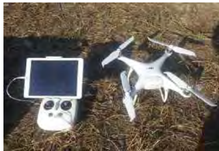
【ドローンで高精度測量を実施】