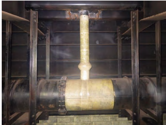
【橋梁内部の配管補修】