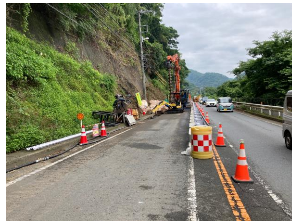
現場状況(御殿場側)