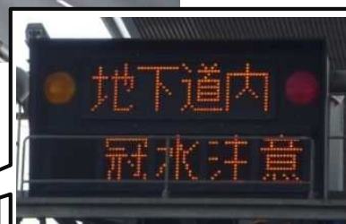
電光掲示板の表示例