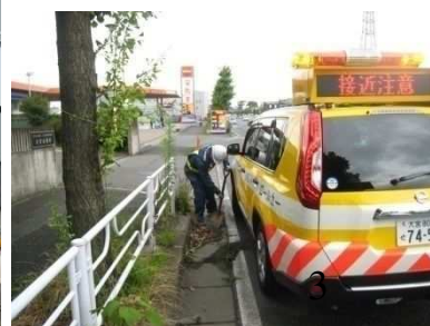
④パトロールの強化