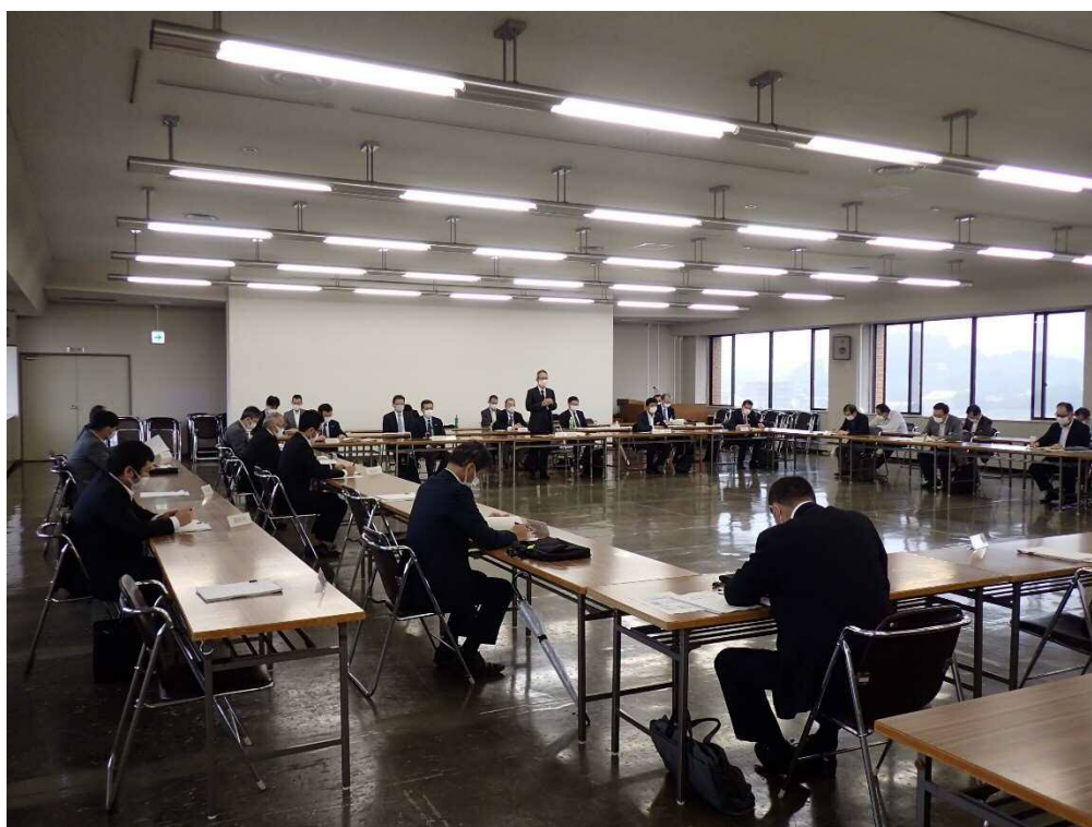
令和2年度 会議開催状況