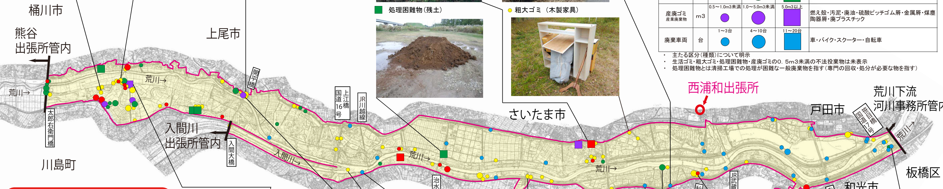
西浦和出張所管内種類別ゴミ投棄量(m3)