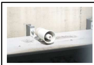
③警報装置 (音声による注意喚起)