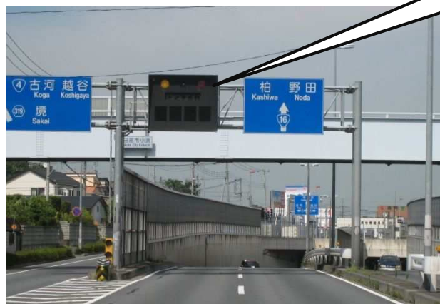
②電光掲示板(地下道手前の情報提供)