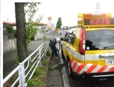
④パトロールの強化