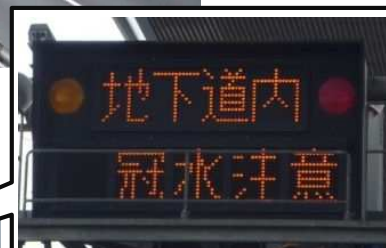
電光掲示板の表示例