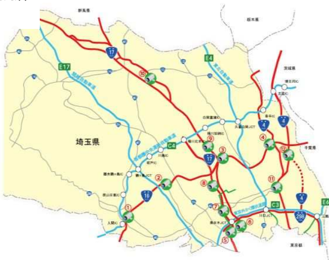
ライブカメラ設置箇所マップ