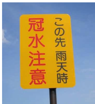
①標識(地下道手前の情報提供)