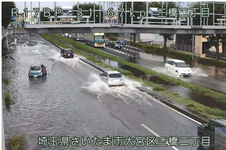
冠水状況（令和2年8月12日 集中豪雨）

局地的な大雨によりアンダーパス部等の車道部など、周囲より低い箇所に雨水が急激に集中して排水処理能力を越えた場合には、一時的に道路が冠水する可能性があり、これにより安全な通行の確保に支障をきたす恐れがある箇所。