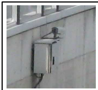
③監視装置 (カメラによる監視)