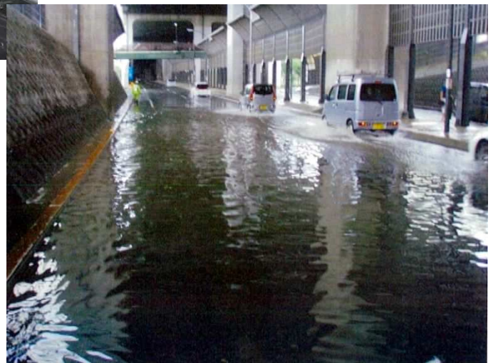
冠水状況（令和2年8月12日 集中豪雨）

国道17号（新大宮バypass）さいたま市大宮区三橋地先 （道路冠水箇所リストNo. 249）