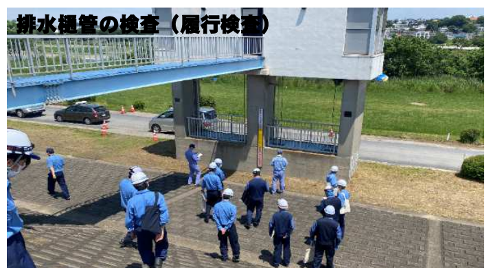
排水樋管の検査（履行検査）