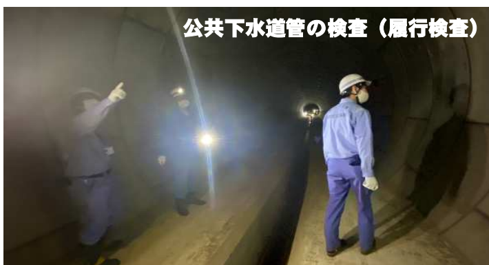
公共下水道管の検査（履行検査）