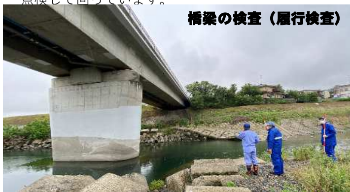
橋梁の検査（履行検査）

言うまでもなく、堤防は洪水から町を守る重要な施設です。堤防そのものに変状・変化が見られないか、また堤防に悪影響を及ぼす河床低下や河岸浸食、局所洗掘等の河道変化など川の様子に異常がないかなどを職員が見て回ります。必要に応じ対策を講じるとともに、亀裂や沈下等の変状の記録はデータベースに蓄積し経年の変化も追っていきます。平時はバイクでの巡視がメインになっていますが、「堤防点検」は徒歩で点検して回っています。