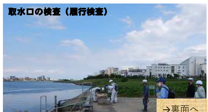
取水口の検査（履行検査）