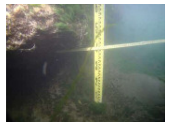
基礎の洗掘の状況