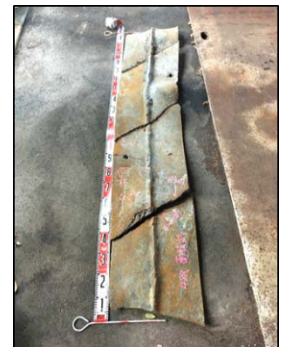
撤去した支障物（鋼材）の一部