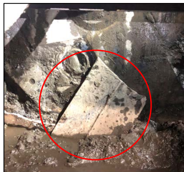
地中内の支障物（鋼材）