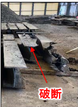
引き抜いた支障物（鋼材）