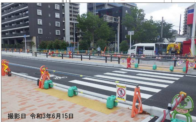
撮影日 令和3年6月15日

市役所駐車場前付近の横断歩道の利用開始は袖ヶ浦公園前付近の横断歩道の利用実態などを検証し決定していきます。