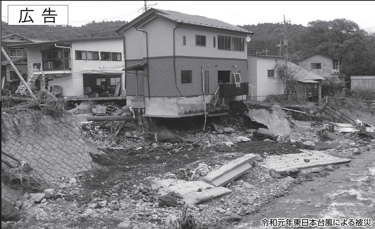
令和元年東日本台風による被災