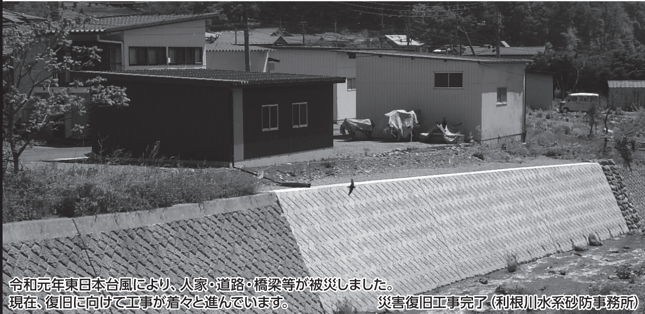
令和元年東日本台風により、人家・道路・橋梁等が被災しました。 現在、復旧に向けて工事が着々と進んでいます。 災害復旧工事完了(利根川水系砂防事務所)