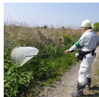
環境調査(昆虫類)イメージ

※各種調査の施工業者は、必ず、荒川上流河川事務所発行の身分証明書を携帯しています。 不明な点等がございましたら、問い合わせ先までご連絡ください。