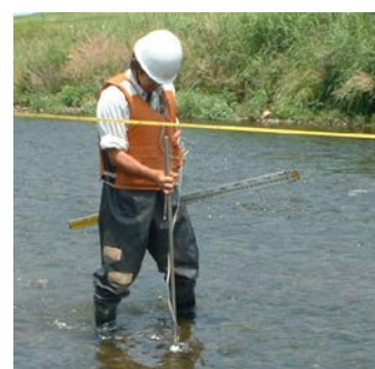
水路調査(流量・流向等)イメージ