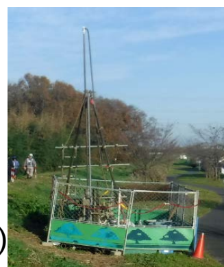
地質調査イメージ