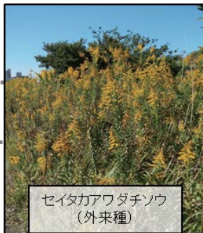
セイタカアワダチソウ (外来種)