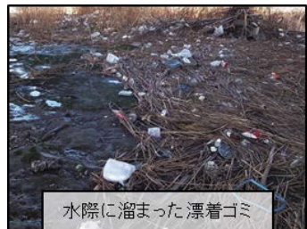
水際に溜まった漂着ゴミ