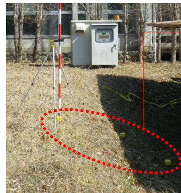
プラスチック製の杭▶

「幅杭」は写真①のような黄色で着色された四角いプラスチック製のものとなります。他にも写真②のような「鉸：鉄製の釘タイプ」もあります。