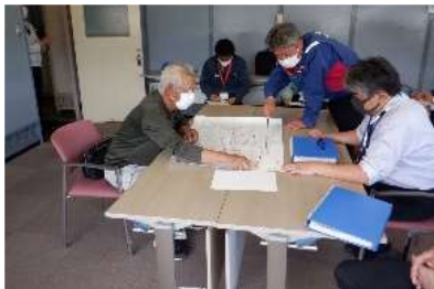
▲大子町大子地区（大子町役場）