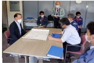
▶大子町傾藤北地区 (大子町役場)