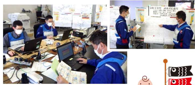
常陸河川国道事務所での洪水対応演習の様子