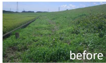
木島大橋上流右岸(那珂市)施工事例