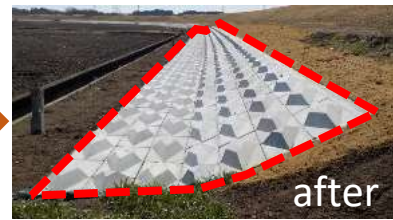
本米崎右岸(那珂市)施工事例