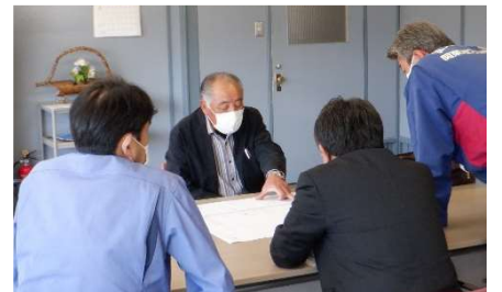
▲大子町矢田地区（大子町役場）