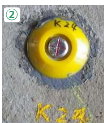
鉸：鉄製の釘タイプ▶