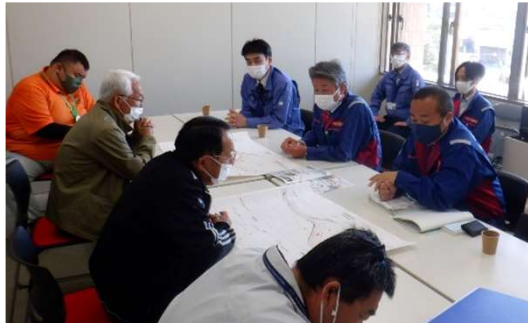
▲那珂市本米崎地区 (那珂市役所)