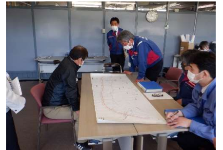
▼大子町下野宮地区（大子町役場）