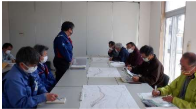
日立市神田町（久慈川 日立南交流センター）