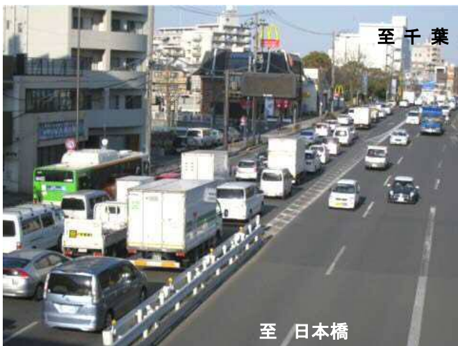
ひがしこまつがわ 東小松川交差点付近