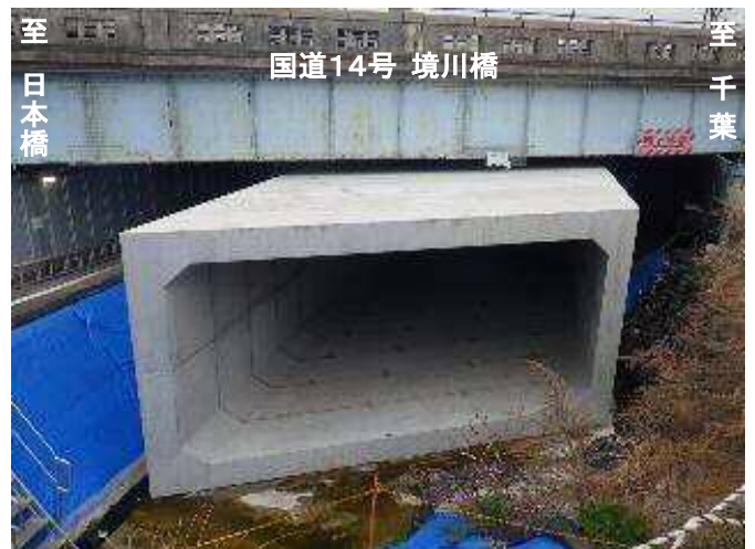
さかいがわ 境川橋の施工状況