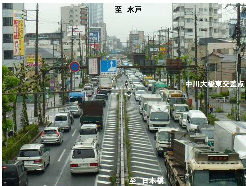
なかがわ 中川大橋東交差点付近