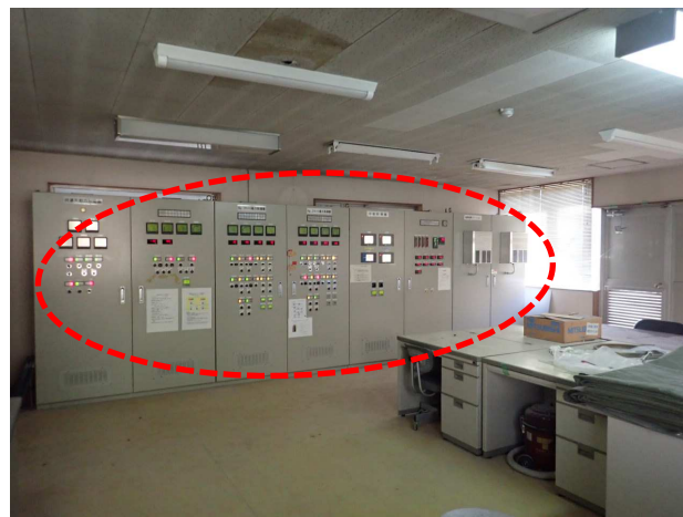
機側操作盤の更新