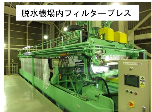
脱水機場内フィルタープレス