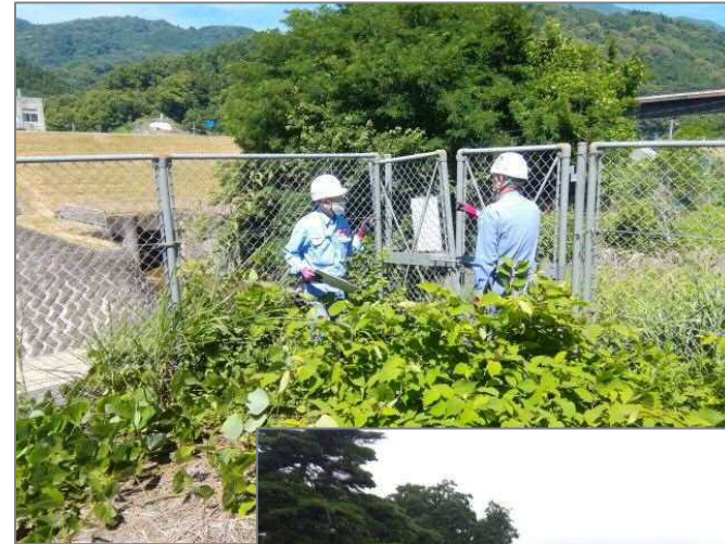
安全利用点検の実施状況