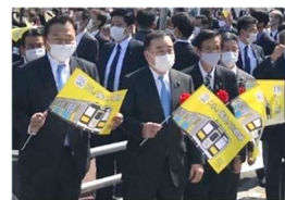
知事らによる歓迎