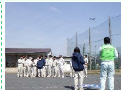
ドローン 操作体験

参加した生徒から、「河川の氾濫場所を分担し夜間にも復旧作業を行い、私たちは沢山の人手と苦勞で守られていることが分かった。」といった感想が寄せられました。