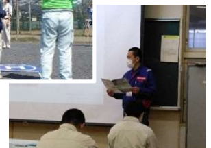
プロジェクトの進捗状況説明