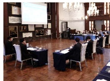
大子まちなかビジョン 推進協議会

大子町では、令和元年東日本台風での甚大な被害を受け、昨年10月から、庁舎移転に伴う防災力の強化や、交流人口の増加によるにぎわいづくり等を盛り込んだ、大子まちなかビジョンの検討を開始し、3月31日に策定、公表されました。ビジョンには、現在の役場庁舎跡地の利活用や「道の駅奥久慈だいち」の防災・交流機能強化を中心とした今後の大子町の取り組みや、久慈川緊急治水対策プロジェクトが盛り込まれています。